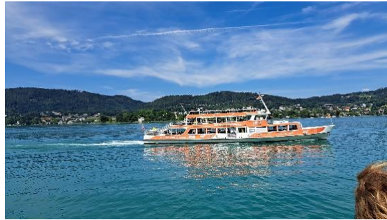
Een dagje varen op de Wörthersee