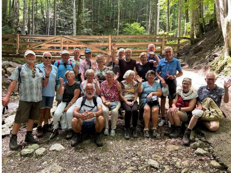
Wandelen door de dr. Vogelsangkloof naar de waterval