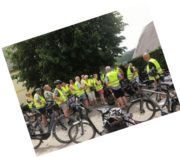
Impressie van een (voor sommigen te) zware fietstocht in de omgeving van Weisskirchen