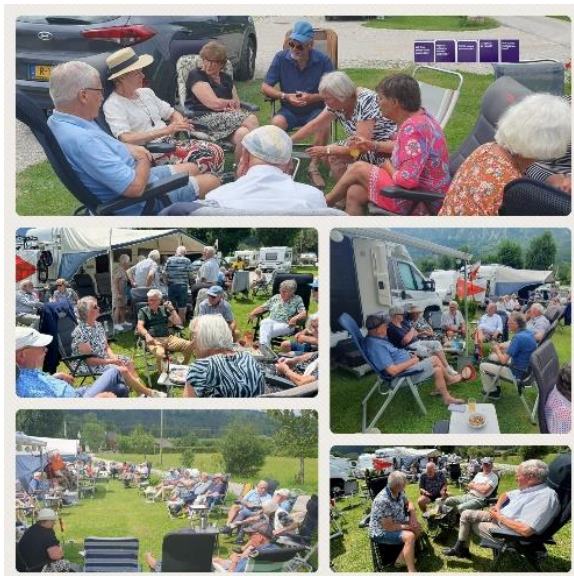
Zondag in Spital am Pyhrn