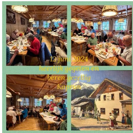
Heerlijke maaltijd in Kaprun