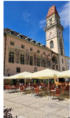
Twee weken na hoog water in de stad