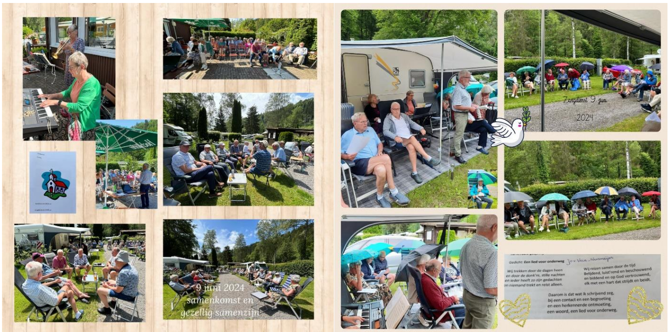
Diensten op camping Carpe Diem in Wildberg (met Zonneschijn en Regen)

Gedicht: Een lied voor onderweg Jan Veen - Nieuwegein Wij trekken door de dagen heen en door de donk're, stille nachten en ander heeft zo zijn gedachten er niemand trekt en reis't alleen. Wij reizen samen door de tijd Belydend, luist'rend en beschouwend en liddend en op God vertrouwend, elk met een hart dat strijft en beeldt. Daarom is dat wat ik schrijvend zeg, bij een contact en een begroeting en een herkenkende ontmoeting, een woord, een lied voor onderweg.