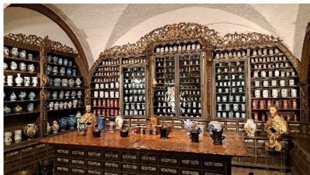
Heidelberg met apotheekmuseum