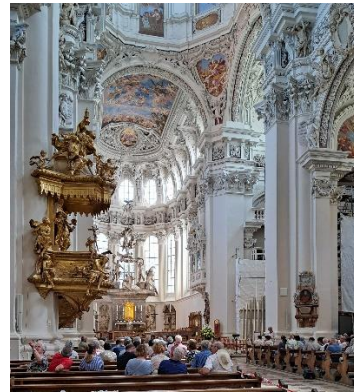
De rondleiding eindigde bij de dom voor een orgelconcert in de Dom