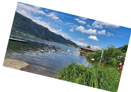
Fietstocht van ongeveer 30 km: Rondje om de Ossiachersee