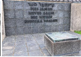
Een indrukwekkend bezoek aan het voormalig concentratiekamp Dachau.