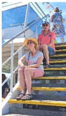
Zoek de schaduw maar op