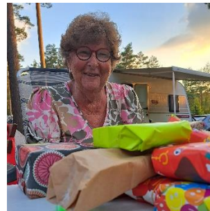
Het Cadeauspel was weer een succes.