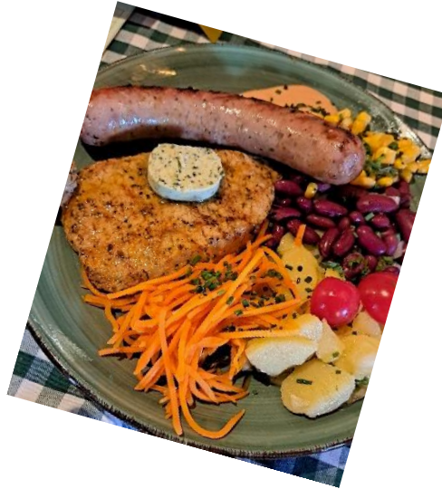
Overheerlijke BBQ op 50+camping Fisching in Weisskirchen