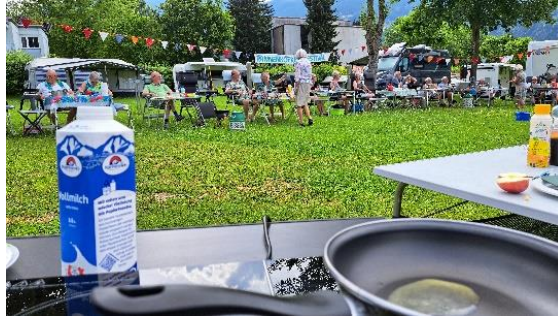
Het pannenkoekenfestijn mocht niet ontbreken.