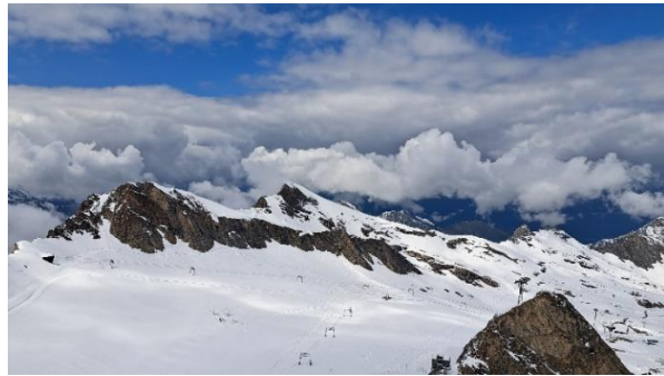
Met de lift naar grote hoogte: Kitzsteinhorn 3029 m.