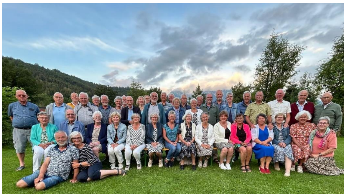
De gezellige groep compleet op de foto.