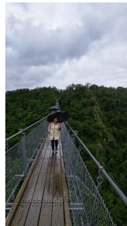
De langste hangbrug van Duitsland Geierlay. (helaas een regendag)